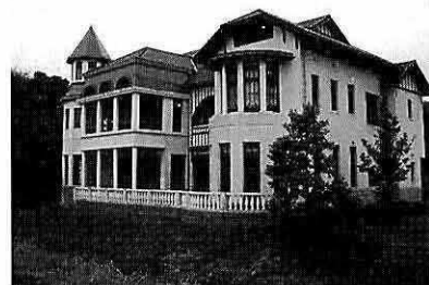
現況 北側外観 (移築の際に反転して建てられている)

今回は篠山市内にある「お菓子の里 丹波」の敷地内に移築され、「丹波ウィーンの館」として甦った「旧垂水警察署(神戸市垂水区)」を紹介します。前回の八上小学校と同日の取材で、真夏とは思えない少し肌寒い雨の降る日でした。