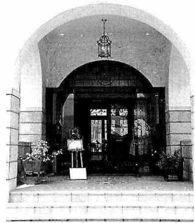
現況 エントランス