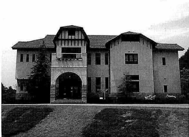
現況 南側外観(移築の際に反転して建てられている)