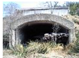
鵜野飛行場防空壕跡